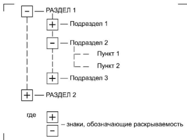
Рисунок 8 - Пример визуального представления оглавления ИЭД

Примечание - Последовательность и содержание разделов, подразделов, пунктов устанавливают соответствующими нормативными документами.